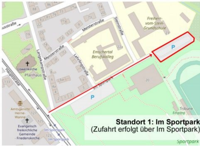
Standort 1: Im Sportpark (Zufahrt erfolgt über Im Sportpark)