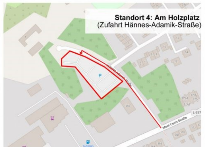
Standort 4: Am Holzplatz (Zufahrt Hännes-Adamik-Straße)

Entsorgung Herne stellt von Mittwoch 15.04. bis Samstag 18.04. Großcontainer oder Presscontainer für die Anlieferung von Grün- und Gartenabfällen an ausgewählten Standorten auf: