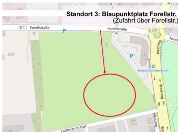
Standort 3: Blaupunktplatz Forellstr. (Zufahrt über Forellstr.)